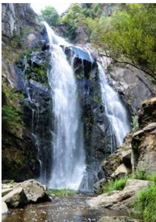
Fervenza do Toxa