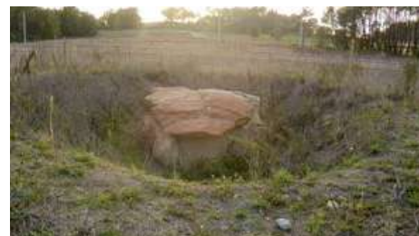
Mámoa de Chousa Nova I