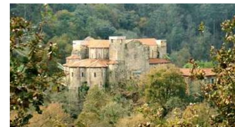
Mosteiro de Carboeiro